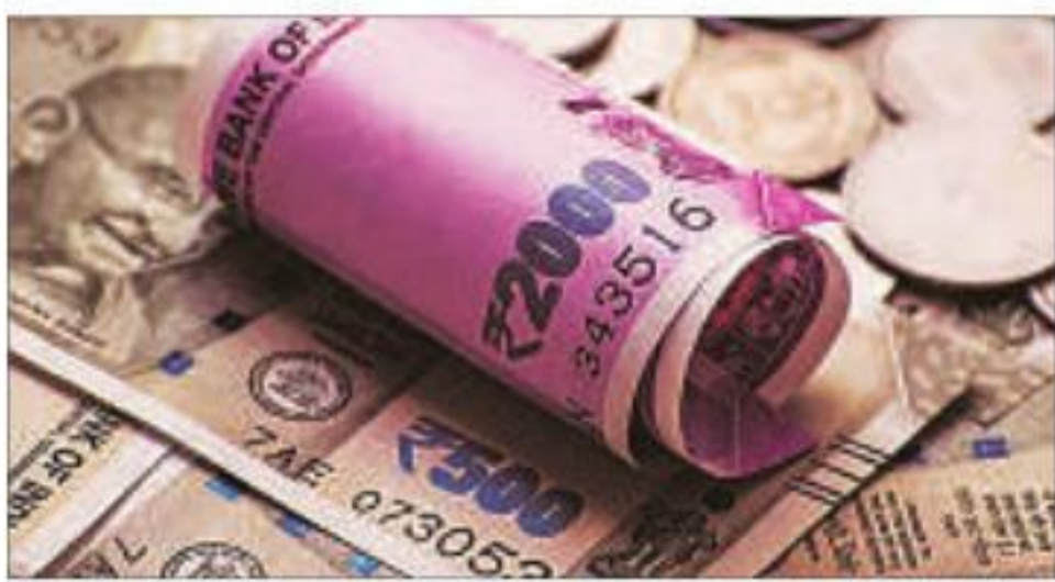
As many as 37 more applications, seeking financing of up to ₹11,037 crore, are under process

THE FINANCE MINISTRY on Saturday said 15 proposals worth ₹6,399 crore of stressed NBFCs and HFCs have been sanctioned under the special liquidity scheme announced as part of the ₹20.97-lakh crore 'Aatmanirbhar Bharat' package. The scheme launched on July 1 permits both primary and secondary market purchases of debt and seeks to address the short-term liquidity issues of non-banking financial companies (NBFCs) and housing finance companies (HFCs). "The Special Liquidity Scheme (SLS) of ₹30,000 crore was announced as a part of the #AatmanirbharBharat package with an aim to improve the liquidity position of NBFCs and HFCs," finance minister Nirmala Sitharaman said in a tweet. Sharing implementation status update of the scheme, she said, 15 proposals with a total sanc-