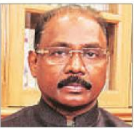
A former bureaucrat, Girish Chandra Murmu is a 1985-batch IAS officer of Gujarat cadre. His tenure as the new CAG will be up to November 20, 2024

GIRISH CHANDRA MURMU has assumed office as the Comptroller and Auditor General of India from Saturday, an official statement said. Earlier in the morning, the former Jammu and Kashmir Lt governor was sworn in as the Comptroller and Auditor General at Rashtrapati Bhavan. Murmu made and subscribed to the oath of office before President Ram Nath Kovind, according to a Rashtrapati Bhavan statement. A former bureaucrat, Murmu is a 1985-batch IAS officer of Gujarat cadre. His tenure as the new CAG will be up to November 20, 2024.